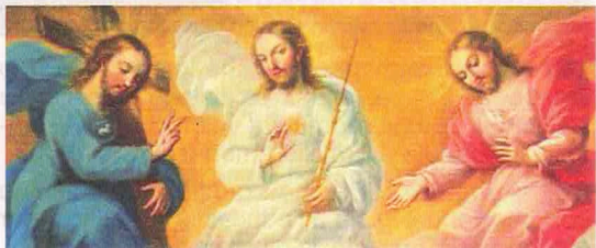
Miguel Cabrera, "Presentazione della Vergine di Guadalupe con la Santissima Trinità...", partic. (1767).