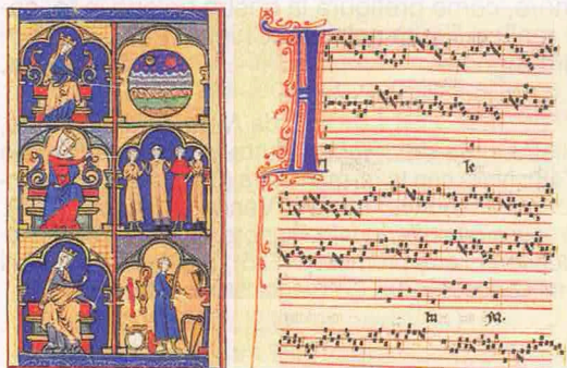
Miniatura dal codice "Magnus Liber Organi" (Grande libro dell'Organum), raccolta di composizioni medievali, pubblicata tra il XII e il XIII sec. Viene attribuita ai maestri che operavano nella Scuola di Notre-Dame. A destra: a uno di questi maestri, Perotin, è attribuito l'Alleluia nativitas , qui riprodotto in una pagina del "Codex Guelph. 1099" (XIII sec.).

La partecipazione del popolo al canto, già venuta meno nei secoli precedenti, era ora discriminata anche a livello culturale essendo i nuovi stili di canto non confacenti alla sensibilità del popolo, ormai costretta a forgiarsi sulla musica profana per esprimere il sentimento religioso. L'intervento deciso del Magister cercò di arginare le esagerazioni stilistiche, in primo luogo attraverso il rifiuto di ciò che non era ritenuto degno per la liturgia (come l'uso della voce). Nonostante ciò, la preghiera con il canto restava compromessa e richiedeva venti di rinnovamento o di restaurazione. M° Sergio Militello