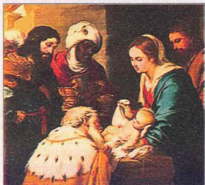
BARTOLOMÉ ESTEBAN MURILLO