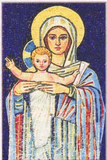
REGINA APOSTOLORUM (mosaico, comunità paolina di Cinisello Balsamo MI)